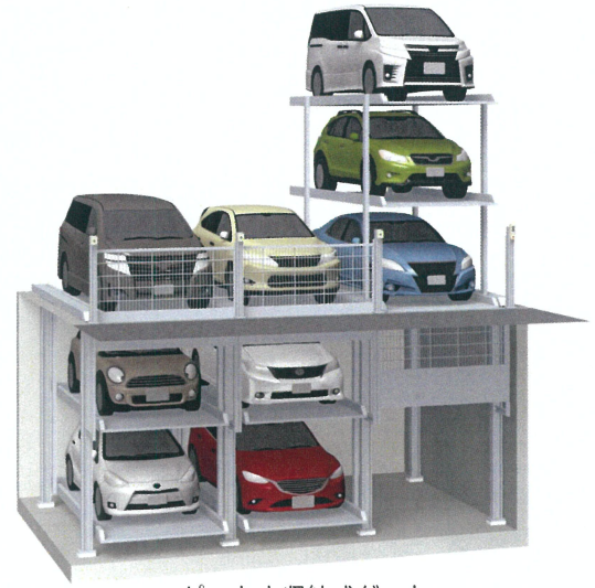
ピット内収納式ゲート